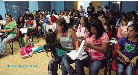
Reunión de apoderados